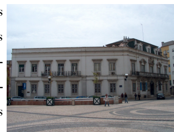
Edifício da actual Assembleia Distrital. Antigo edifício da Junta Geral do Distrito de Faro.

Entre 1960 e 1974 o Distrito passou a ter a função de coordenação e apoio das actividades municipais mas a escassez das receitas próprias não consentiu grandes ousadias nas realizações.